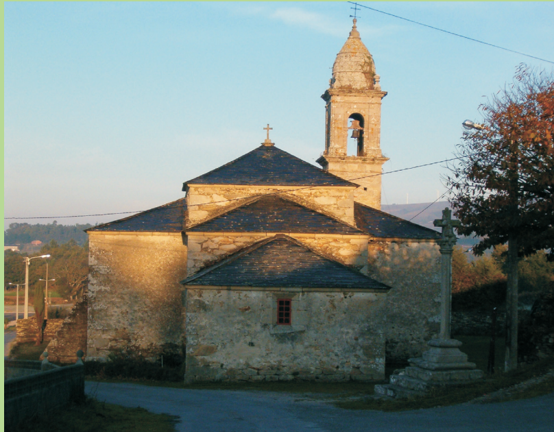
Iglesia Parroquial de San Simón da Costa